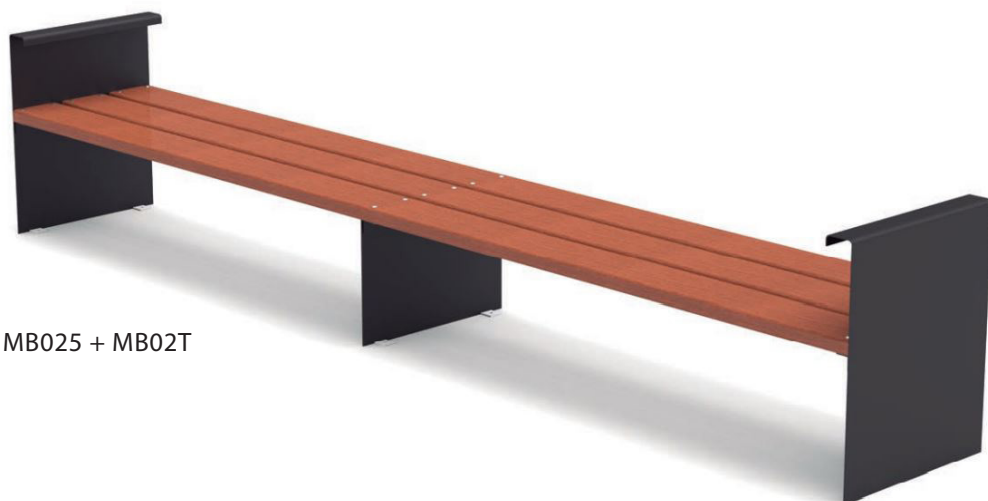
MB025 + MB02T